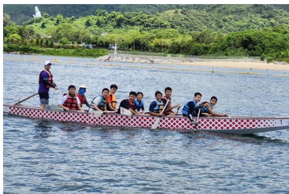
十八鄉第 22 旅 參加新界地域「Aurora」海上活動挑戰日