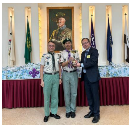
恭喜十八鄉第21旅在2024年度童軍獎券獲「最佳獎券銷售童軍旅」季軍