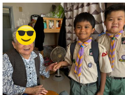
新界第 1651 旅 探訪長者