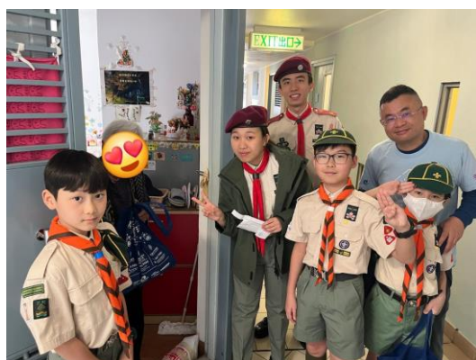
十八鄉第 18 旅及新界第 1654 旅探訪長者