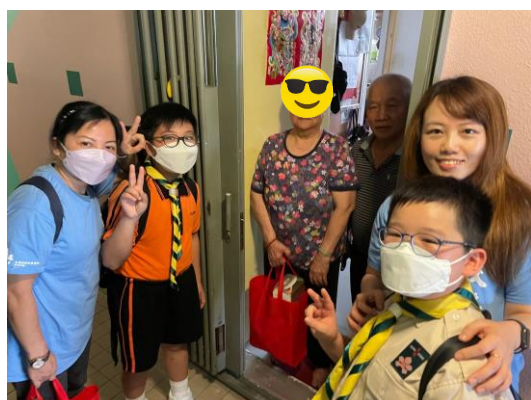
十八鄉第 16 旅 探訪長者