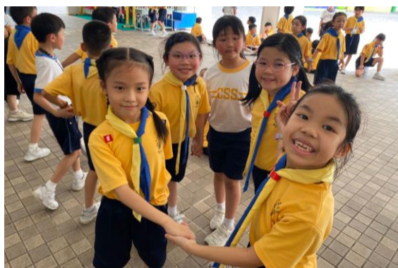
十八鄉第9旅小童軍