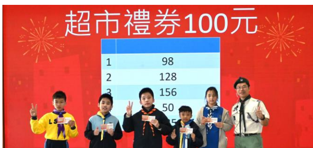
新春團拜餘慶節目幸運大抽獎 (9.2.2025)