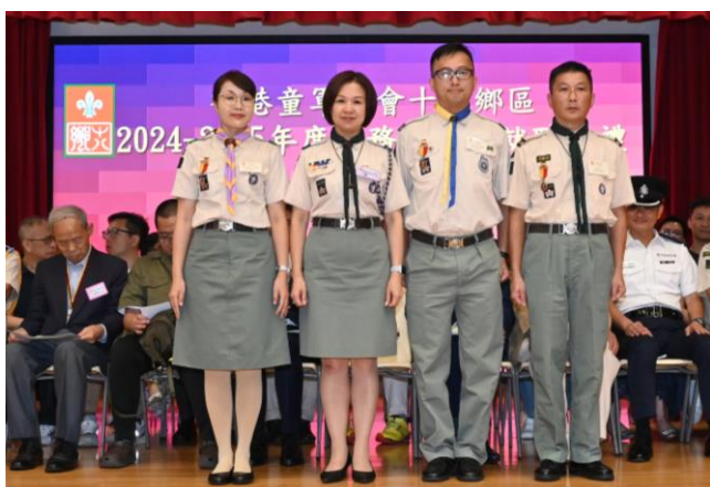
恭喜領袖們獲頒「長期服務獎章」