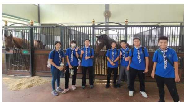
十八鄉區 童軍騎術(興趣組)考驗日