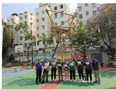
十八鄉區 深資童軍先鋒工程訓練班