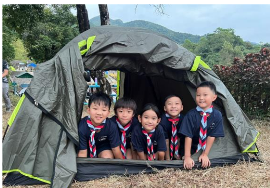
十八鄉第11旅幼童軍 露營活動