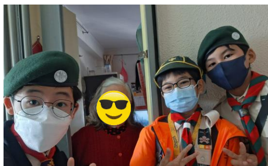
十八鄉第 2 旅及第 18 旅 探訪長者