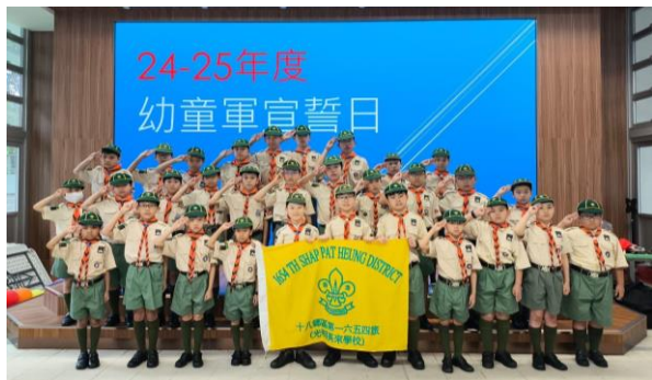
新界第 1654 旅幼童軍