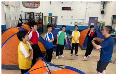
十八鄉第4旅童軍 校內露營活動