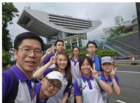
十八鄉第18旅深資童軍 遠足活動