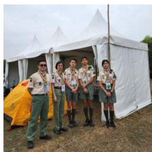
十八鄉第 22 旅 在香港童軍大露營十八鄉區營區留影