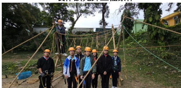
十八鄉區 童軍先鋒工程訓練班