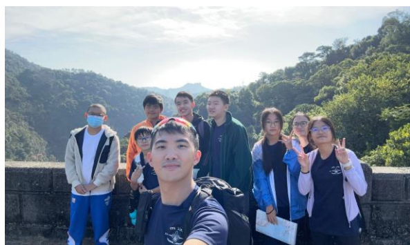
十八鄉第11旅童軍 遠足活動