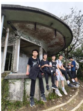
十八鄉第 20 旅 遠足活動