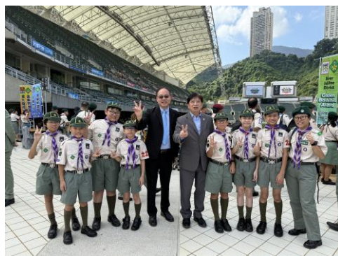
十八鄉第 21 旅幼童軍 參加香港童軍大會操