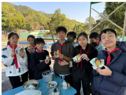
十八鄉第 18 旅童軍 原野烹飪活動