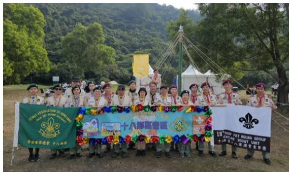
新界地域在香港童軍大露營創意先鋒工程比賽中奪得冠軍，十八鄉區童軍負責策劃及製作該先鋒工程紮作