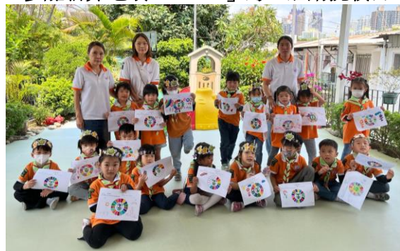
新界第 1725 旅小童軍