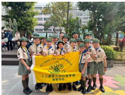
十八鄉第9旅幼童軍