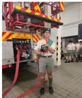
十八鄉區 童軍消防訓練班