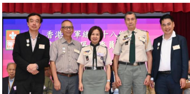
恭喜委員們獲頒「童心抗疫徽章」