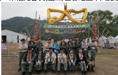
十八鄉第 18 旅 在香港童軍大露營新界地域分營營門留影