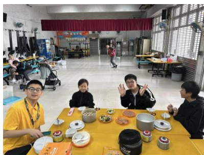
十八鄉第 19 旅童軍