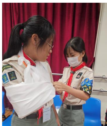
十八鄉區 童軍急救訓練班