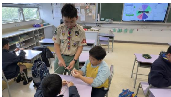
十八鄉第8旅幼童軍