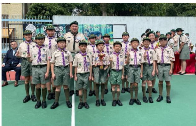
恭喜十八鄉第21旅在新界地域團呼比賽獲優異獎