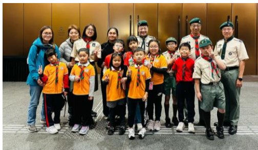
十八鄉第2旅 參觀香港故宮文化博物館