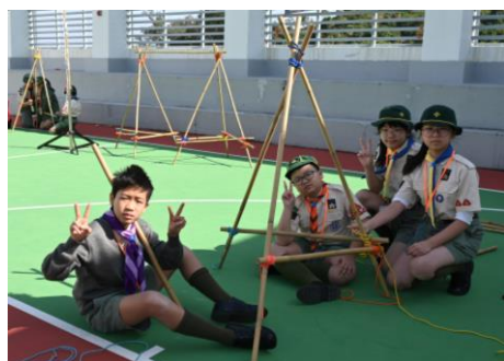
十八鄉區 幼童軍繩結訓練班